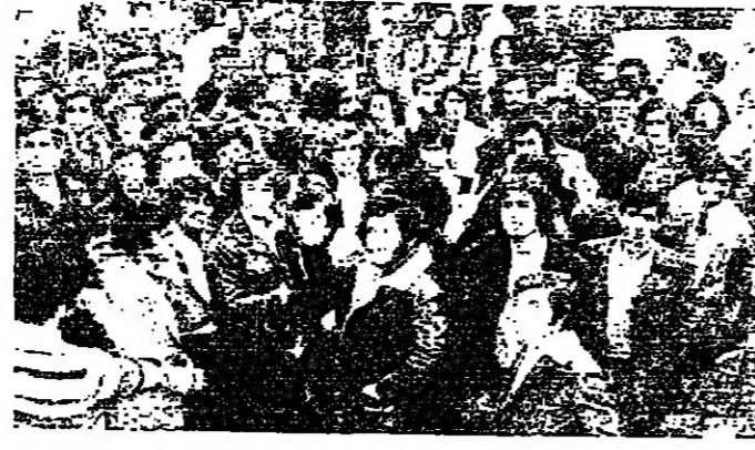
الطلاب المهينون عند تظاهروهم امام وزارة التربية امس